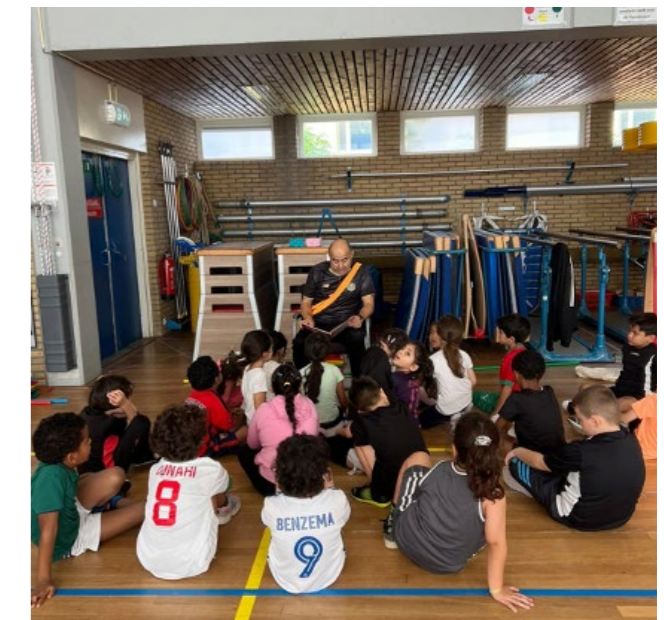
Ook in de gymzaal wordt er voorgelezen tijdens de voorleesochtend.