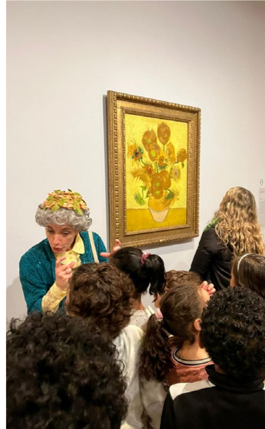
Met groep 4 naar het Van Gogh Museum