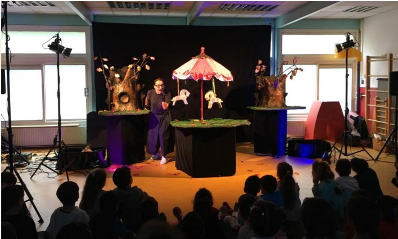
De kleutergroepen genoten van de voorstelling van theater Koekla. Dit in het kader van de Kinderboekenweek thema "Bij mij thuis" en ons Piramide thema "Wonen".