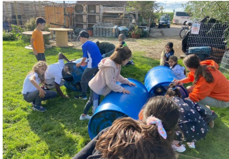
Leerlingen van groep 5 bouwen een auto en racen straks tegen elkaar.