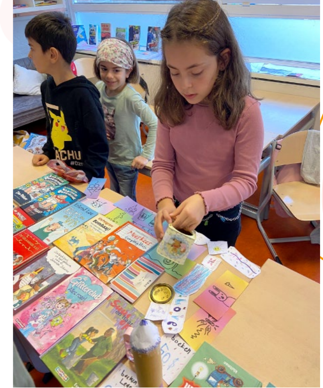
Kinderboekenweek: Boekenverkoop door leerlingen