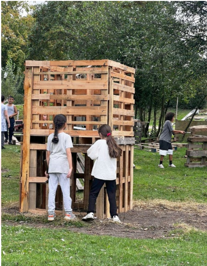
Jeugdland: hutten en skelters bouwen