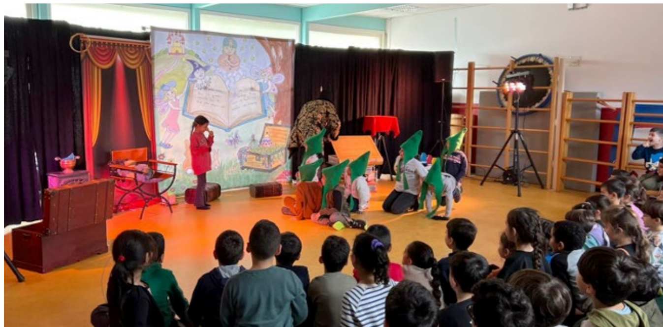
Theatervoorstelling 'Sprookjesverteller' groep 4