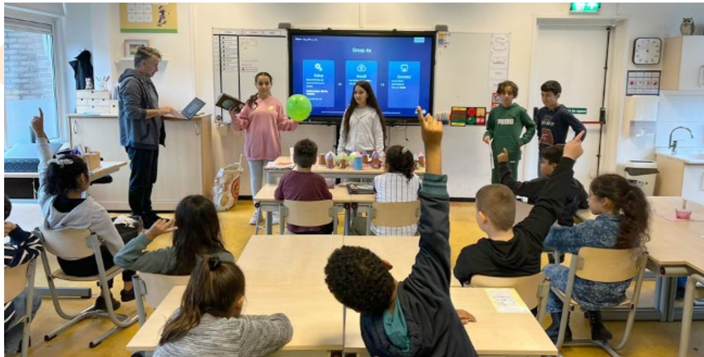
Leerlingen van groep 8 geven een les over zwaartekracht aan groep 6 tijdens een wetenschap en techniekles.